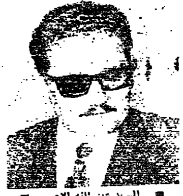
السيد عبد الله الأحمر